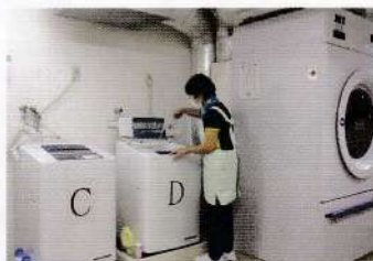
洗濯の除菌消臭に効果