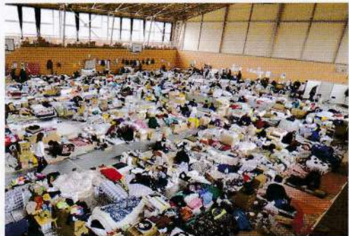
災害時の避難所に