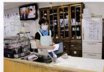
素手で使用しても肌荒れなし