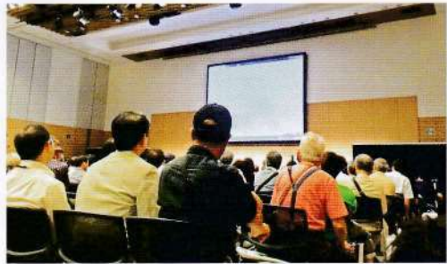
セミナーや会合の場に