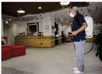
館内すみずみまで噴霧 感染症などに効果を発揮