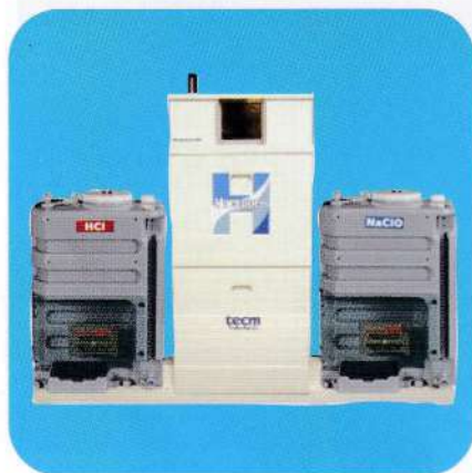
ハセツパー生成装置